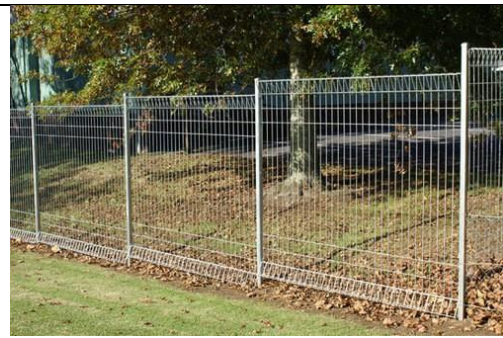
Pagar BRC yang telah siap dipasang.