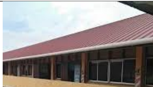
Bumbung yang telah siap dipasang.