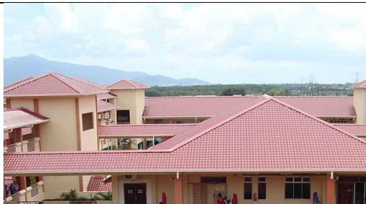
Bumbung yang telah siap dipasang.