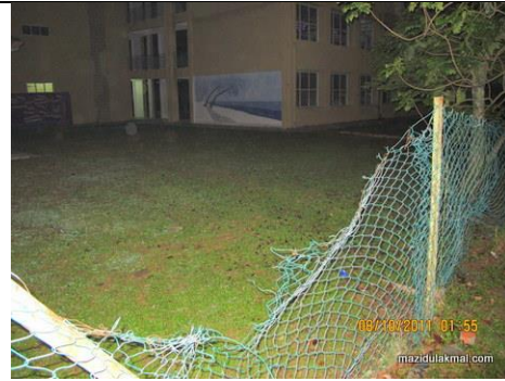
Keadaan pagar yang rosak membolehkan pelajar keluar masuk sesuka hati.