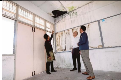
Kebocoran bumbung mengakibatkan air membanjiri bilik asrama semasa hujan.