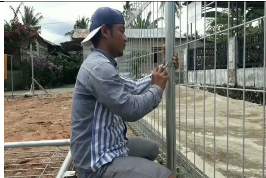
Pemasangan pagar BRC sedang dilakukan di depan sekolah.