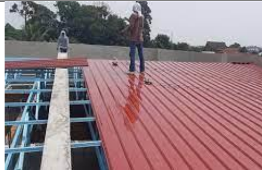
Kerja-kerja pemasangan bumbung metal deck.