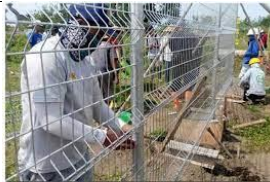
Pemasangan pagar BRC sedang dilakukan di belakang sekolah.