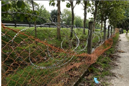
Pagar lama yang telah rosak.