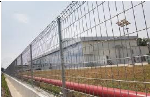
Pagar BRC yang telah siap dipasang.