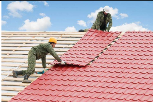
Kerja-kerja pemasangan bumbung metal deck.